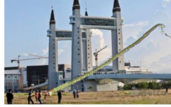
Wau naga 70 meter 27/03/2022