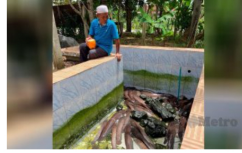
Ternak keli dalam kolam renang cucu 26/03/2022