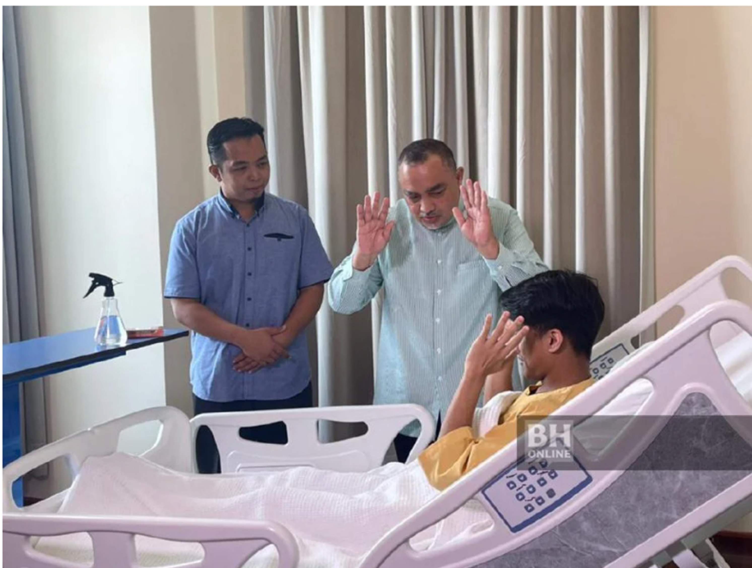
Pegawai agama dan kaunselor membantu pesakit mengenai cara menunaikan solat ketika menjalani rawatan di hospital

Oleh Siti Nur Ain Mat Ripar - April 5, 2023 @ 5:21pm bhnews@bh.com.my