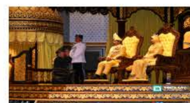
SUK, Exco Terengganu Terima Darjah Kebesaran 18 Jun 2023