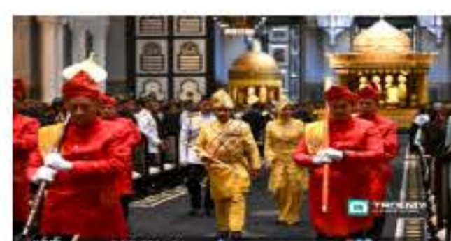
Sultan Mizan Sukacita Perkembangan Pelaburan di Terengganu 19 Jun 2023