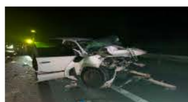
Pasangan Suami Isteri Warga Emas Maut Dalam Kemalangan Di LPT2 19 Jun 2023