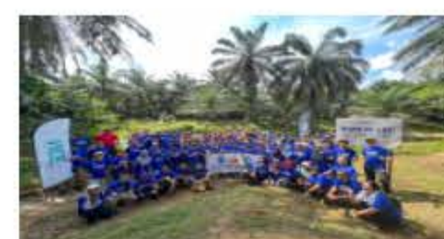
TDM Sedia Rizab 514 Hektar Tanah Untuk Program Releaf Nestle Malaysia 19 Jun 2023