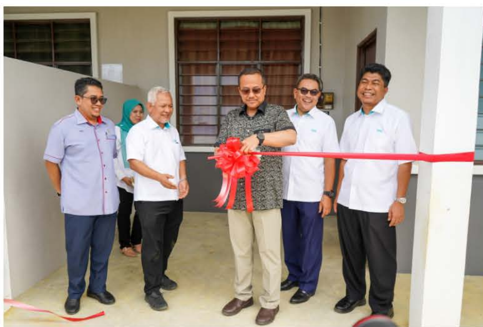
Ahmad Samsuri memotong riben, simbolik perasmian 56 unit rumah baharu untuk pekerja ladang TDM Plantation di Sungai Tong, Setu Terengganu pada 20 Julai 2023.

"Setakat ini, sebanyak 56 unit rumah telah siap dibina di bawah fasa satu, 24 unit lagi sedang dalam pembinaan dan 200 unit lagi akan dibina pada tahun 2023 ini," katanya di Majlis Penyerahan Kunci Rumah Pekerja Ladang Jaya yang disempurnakan Menteri Besar, Datuk Seri Dr Ahmad Samsuri Mokhtar dekat Sungai Tong di sini, Khamis.