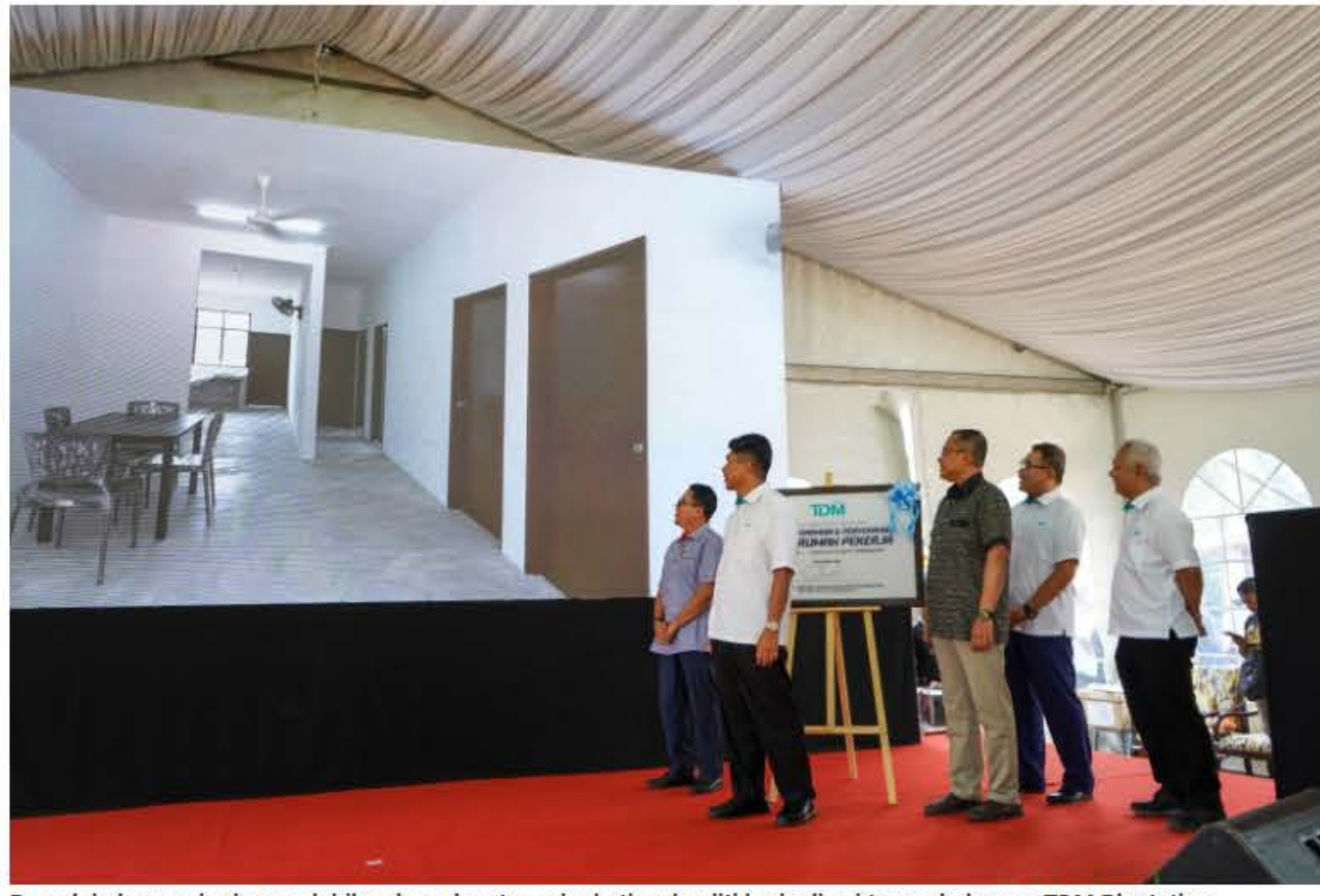
Rumah baharu pekerja agar lebih selesa dapat meningkatkan kualiti kerja di sektor perladangan TDM Plantation.

Mengulas lanjut, Hamdan berkata, TDM Plantation juga mengambil langkah untuk menyediakan kemudahan tambahan seperti pusat kesihatan dan pendidikan untuk meningkatkan kualiti hidup pekerja ladang dan keluarga mereka.