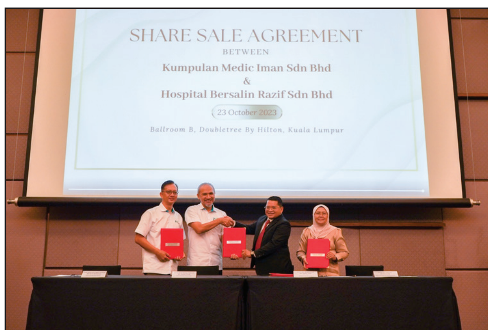
Sejarah bermakna telah tercipta buat KMI Healthcare setelah berjaya memeterai Perjanjian Jualan Saham bersama Hospital Bersalin Razif yang diadakan di Hotel DoubleTree by Hilton, Kuala Lumpur.

Serentak dengan kedua-dua acara itu, Persidangan Kual-