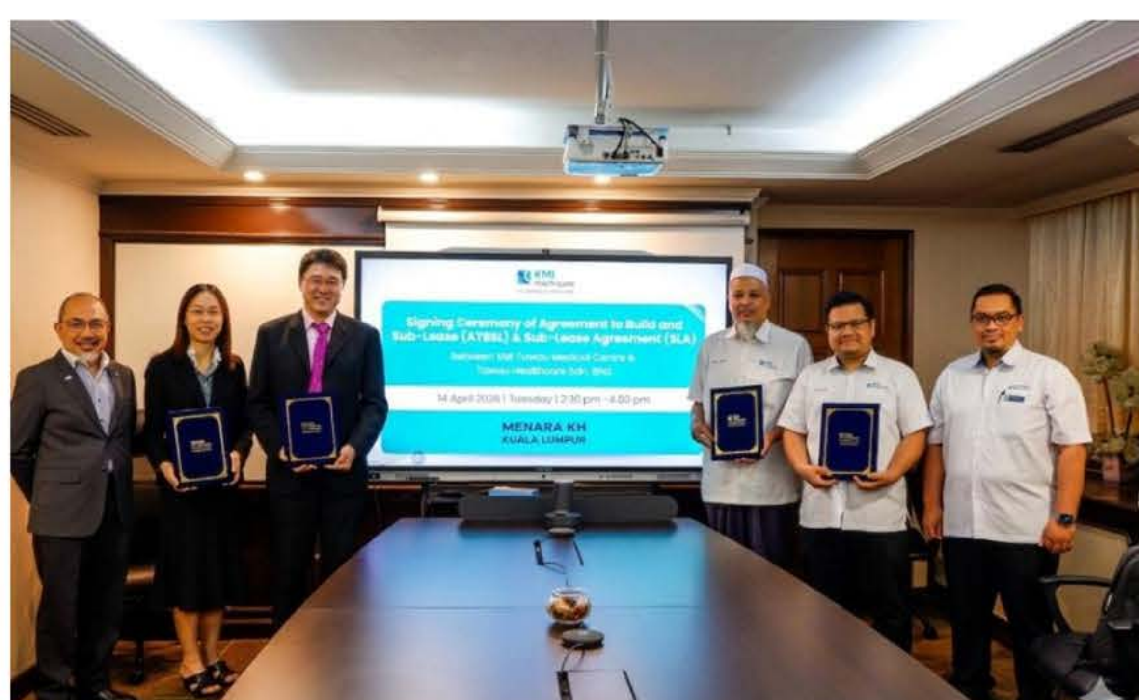
Majlis pemeteraian perjanjian KMI Tawau Medical Centre Sdn Bhd (KMITMC) dan Tawau Healthcare Sdn Bhd (THSB) di Kuala Lumpur pada 14 April 2026.

Oleh JOHARDY IBRAHIM editor@dagangnews.com